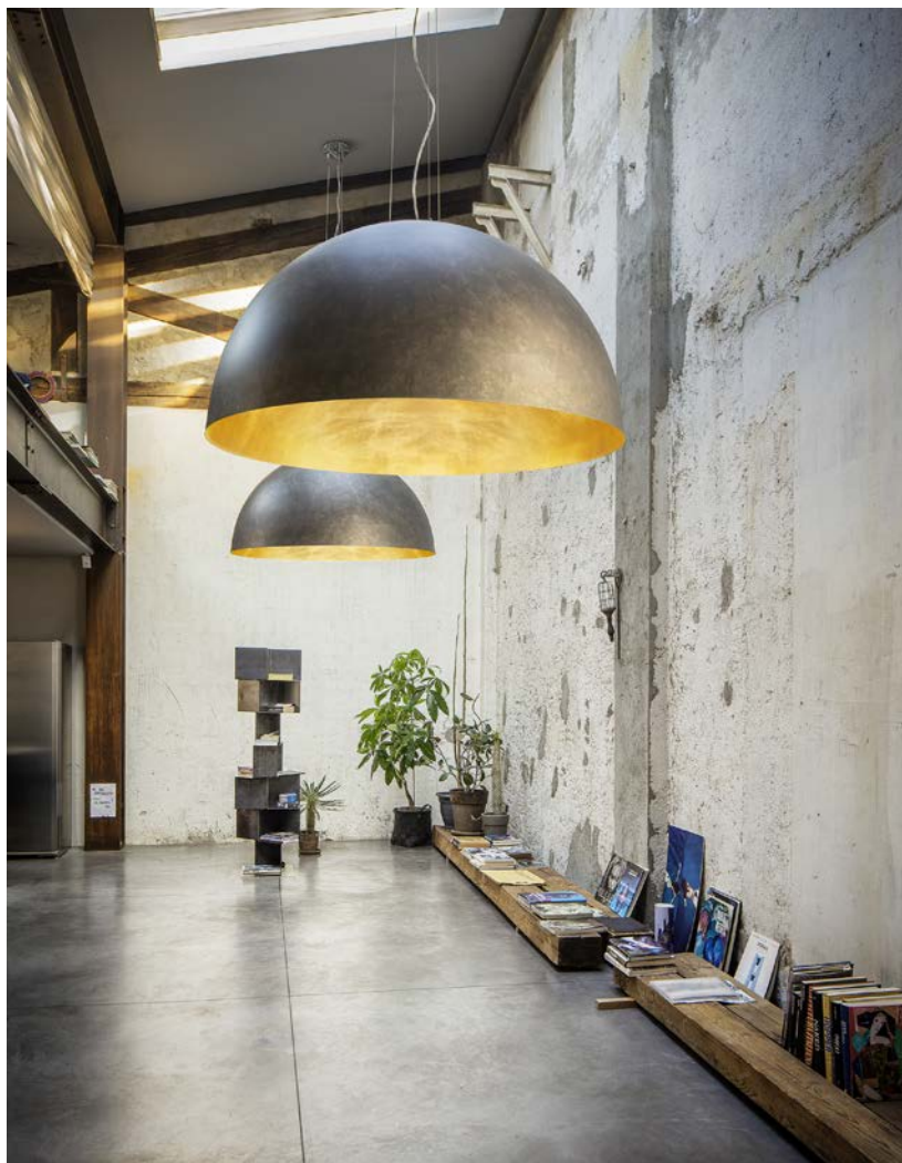
2) Art. MOON3/GF