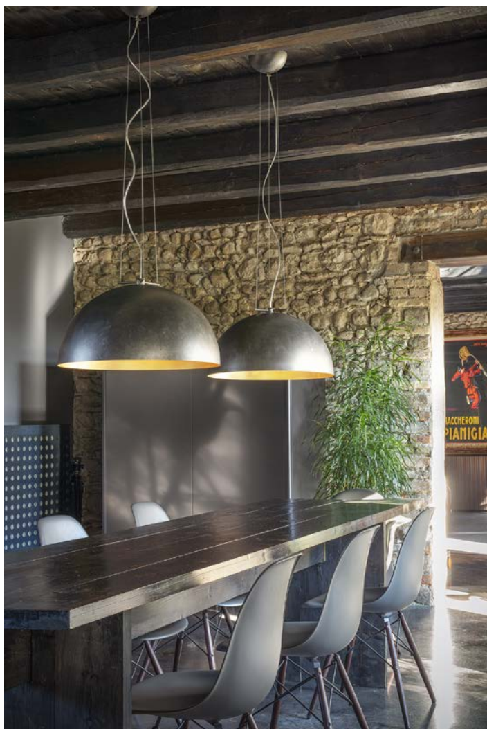
2) Art. MOON2/GF