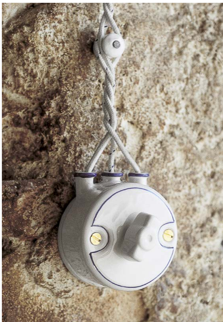
Art. LAR.INT.FB.03 Art. LAR.131.00 Art. LAR.134.A Art. LAR.138.06